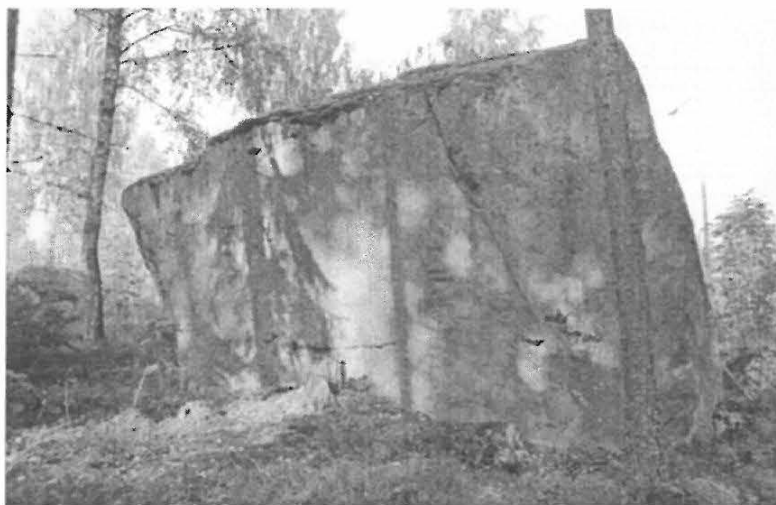
f. 140205 Merikoski, raudanvalmistusuuni siirtolohkareen viiston seinämän keskellä. Etelästä.

Kohde jää valtatie 7 uuden linjauksen pohjoispuolelle, mutta tiesuunnitelmissa on mainittu mahdollisen levähdyspaikan rakentamista kyseisen paikan läheisyyteen. Mikäli rakennushanke osuu muinaisjäännöksen kohdalle tai välittömään läheisyyteen, tulisi se tutkia ennen töiden aloittamista.